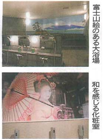
富士山絵のある大浴場